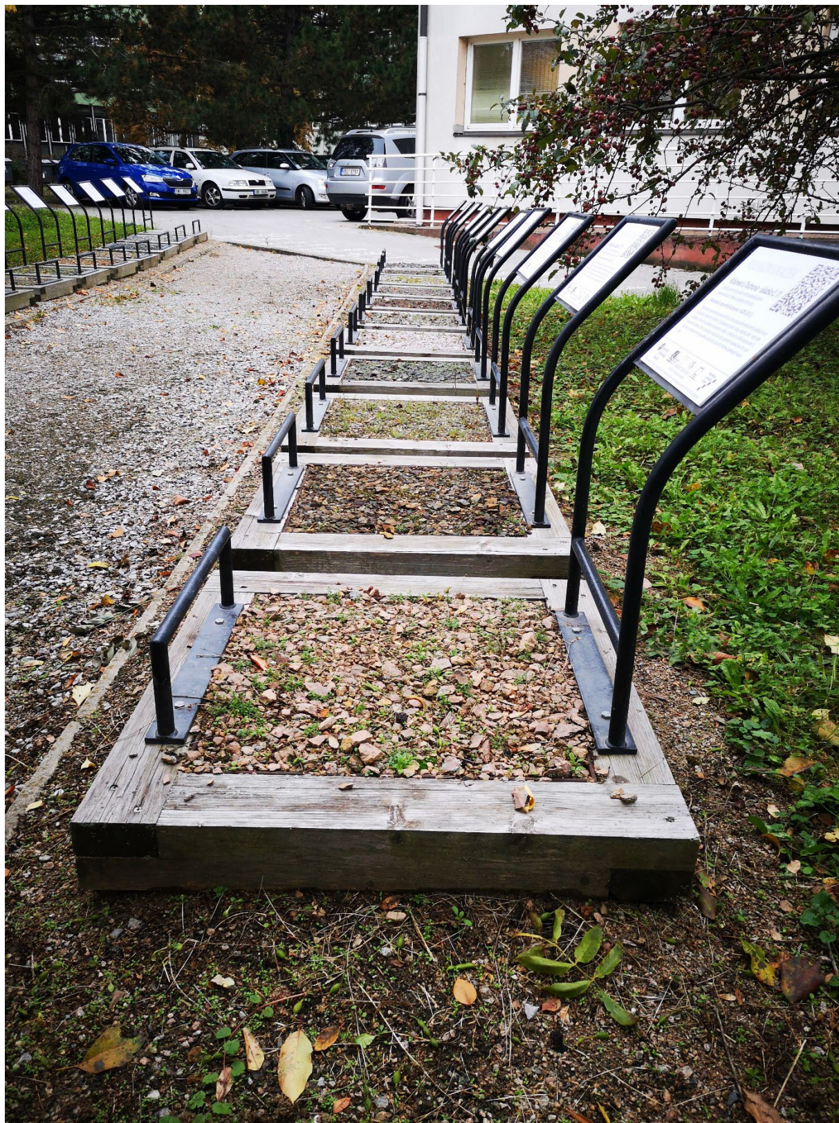
Obr. 4 – Umístění nádob na vzorky kameniva.