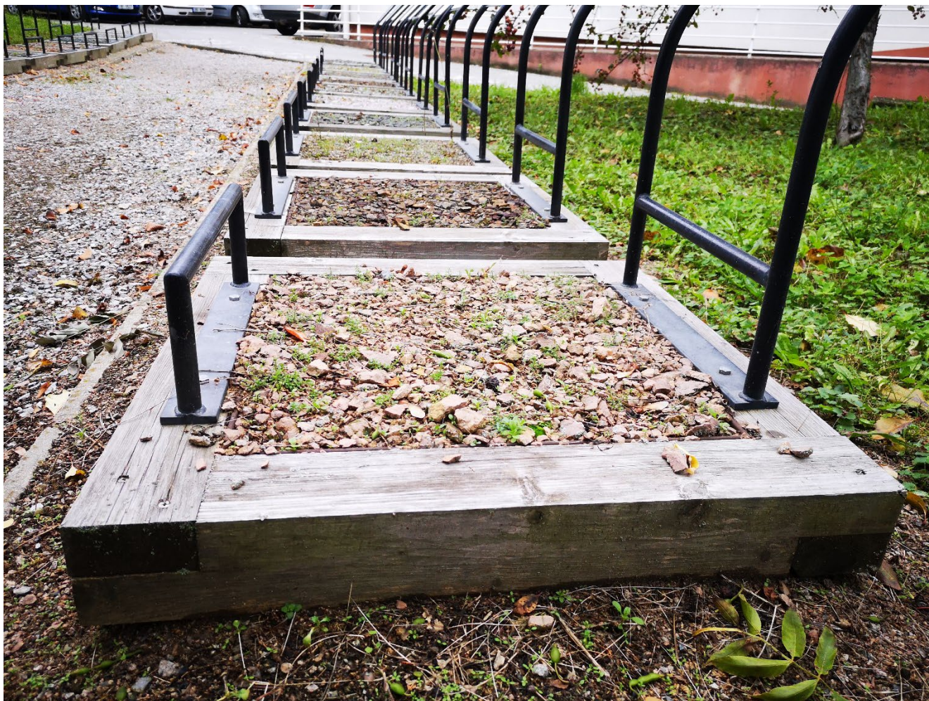
Obr. 2 – Detail nádob na vzorky kameniva.