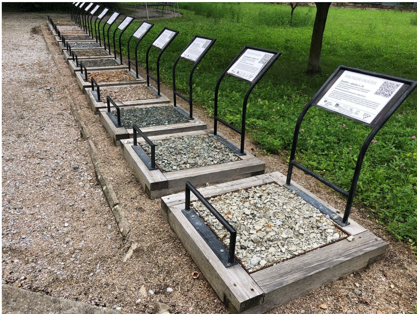
Obr. 3 – Umístění nádob na vzorky kameniva.