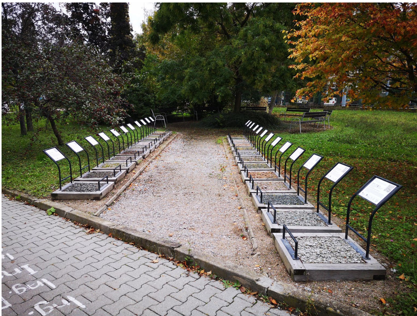
Obr. 1 – Stávající umístění a vzhled nádob na vzorky kameniva.